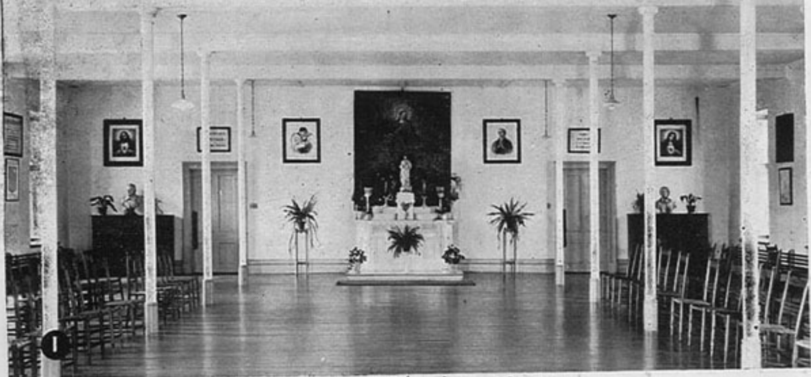
Noviciat, 5 février 1920

Qu'il fait bon ici ! Faites, ô Marie, que je vous imite en tout, que je sois une enfant.