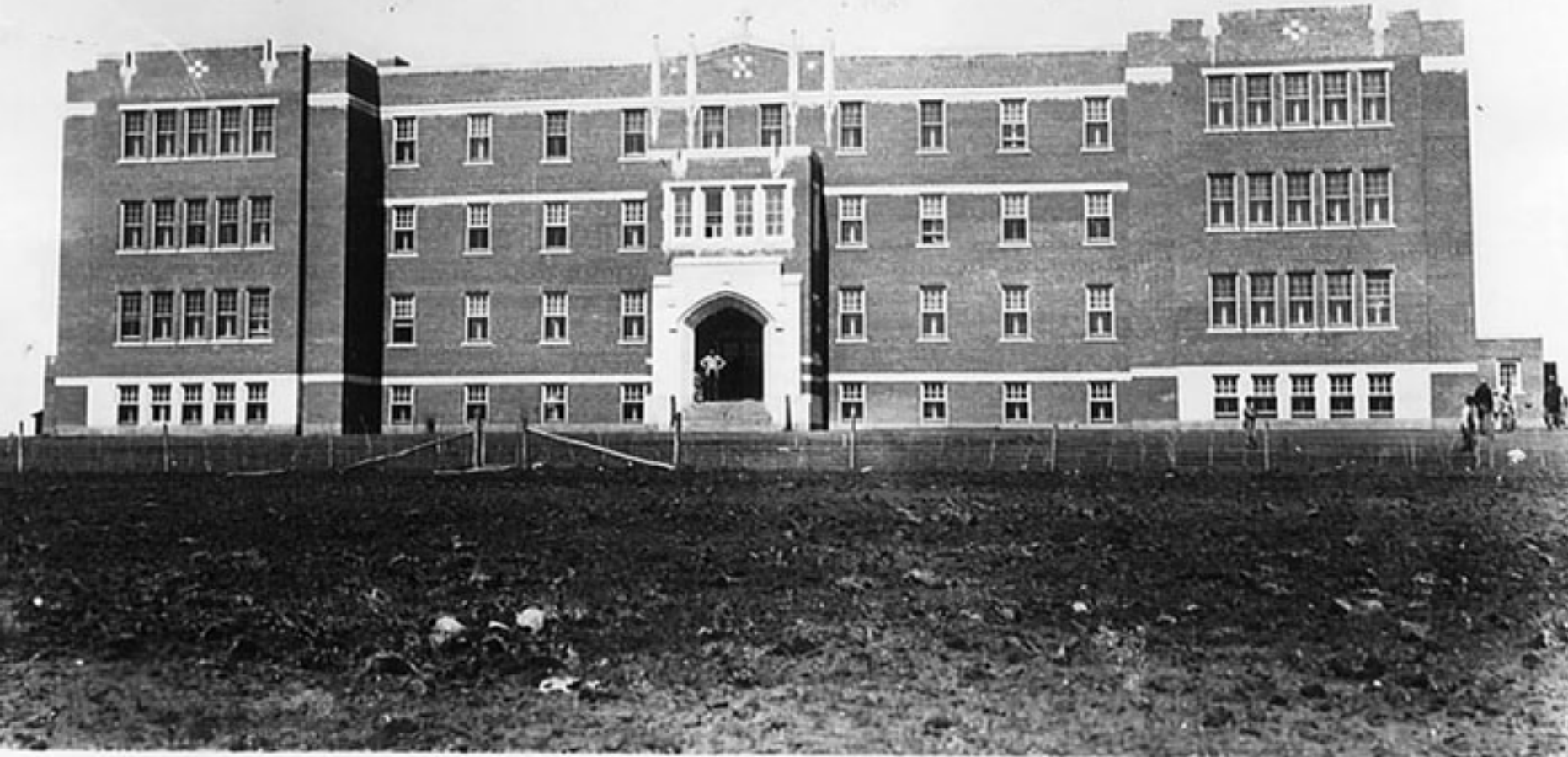
Blue Quills Res. School,