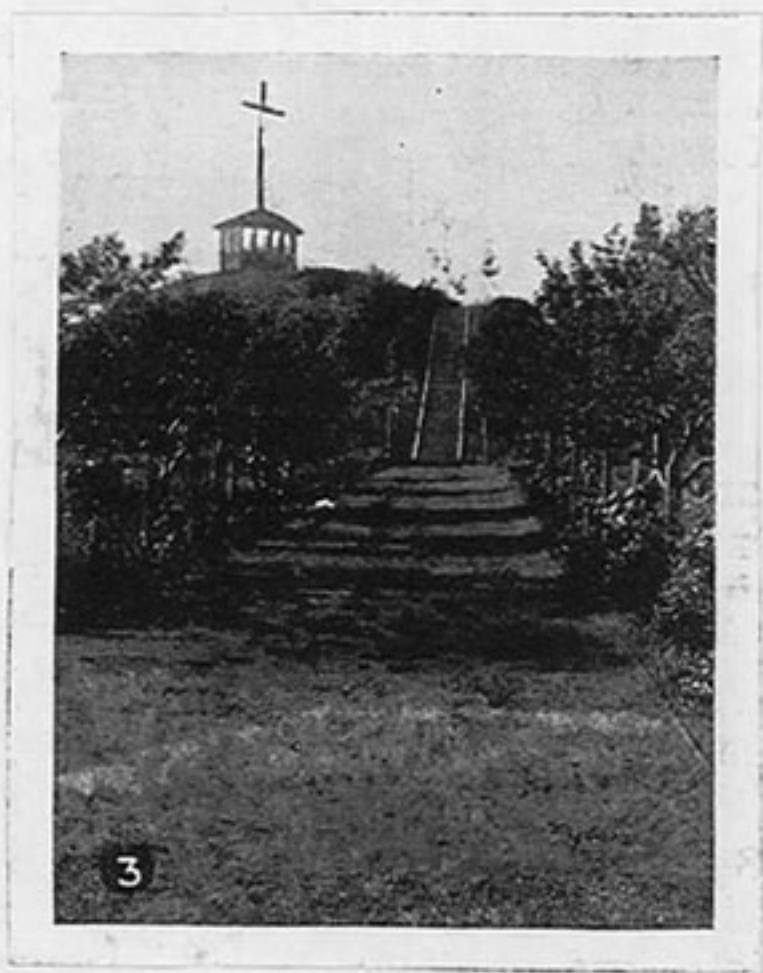
Cimetière des Religieuses Chateauguay.