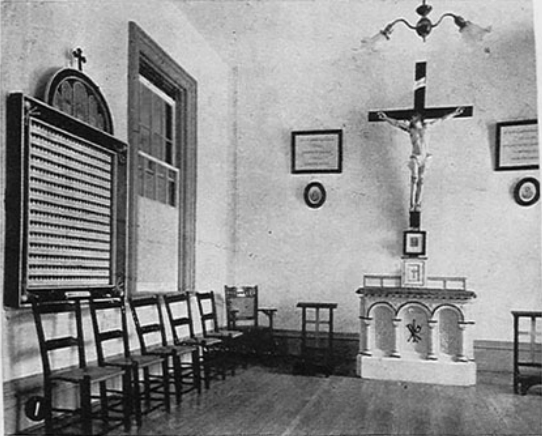
Chambre Mortuaire (Maison-Mère)