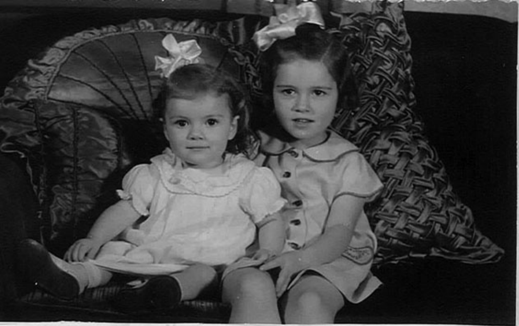
The "Mereer" children -

Il y a maintenant onze ans que je suis ingénieur chez les enfants. Je remercie le bon Dieu de cette grande grâce - L'innocence, la candeur de l'enfance m'a attirée vers les enfants dès mon plus jeune âge. . . .