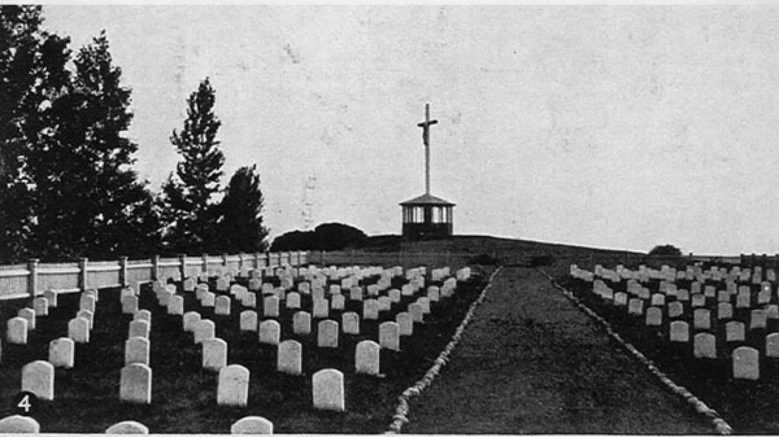
Vue sur le lac St. Louis.