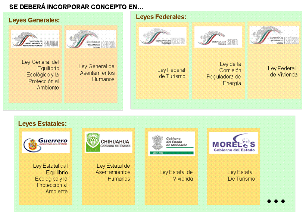
Gráfica 2. Marco legal a modificar